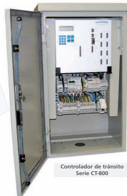
Controlador de tránsito Serie CT-800

Está comprobado que en Argentina el acatamiento a las señales de tránsito por parte de los conductores de vehículos, ciclistas y transeúntes está en relación directa al estado de conservación y funcionalidad de los cruces semaforizados y la coordinación entre semáforos de cruces cercanos. Cuando el sistema de semaforización garantiza la circulación fluida de todos los interesados, se incrementa el respeto y por ende aumenta la seguridad, disminuyendo el nivel de contaminación y consumo de combustible.